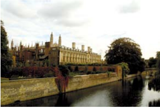
Figuur 2. Universiteit van Cambridge.

veel lokale integratie, maar is het relatief moeilijk om van het ene punt naar het andere te gaan. Een tegengesteld netwerk is het 'willekeurige' netwerk aan de rechterkant, waarbij de padlengte kort is, maar er weinig lokale clustering is. Belangrijk is nu het netwerk in het midden: door slechts een paar lokale verbindingen uit het geordende netwerk naar verder weg gelegen knopen te verplaatsen, blijft de lokale clustering hoog, maar neemt de padlengte aanzienlijk af. Dit netwerk heet een small world-netwerk, en is waarschijnlijk optimaal voor het verwerken van informatie en het functioneren van de hersenen. Een small world-netwerk combineert lokale segregatie met globale integratie.